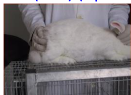
1: Regione lombare (dorso)