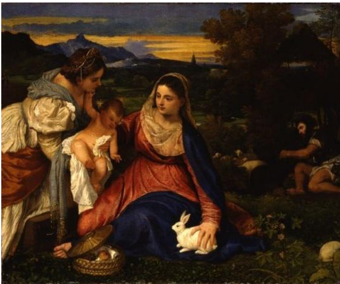
Tiziano Vecellio "Madonna con il Bambino, Santa Caterina e un pastore" detta "Madonna del coniglio" 1520-1530 circa, Musée du Louvre, Parigi